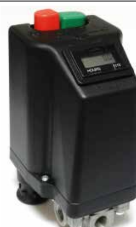
TRIFÁSICOS - COM MEDIDOR DIGITAL