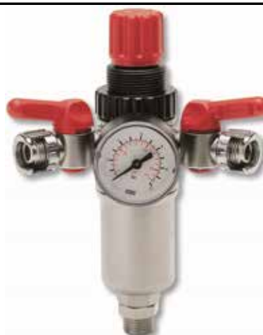
COM MANÓMETRO + 2 TORNEIRA E BAIONETA