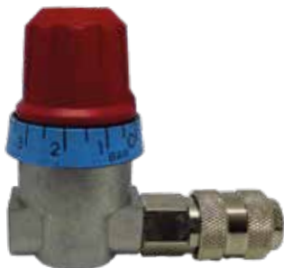
REGULADOR + ENGATE RÁPIDO