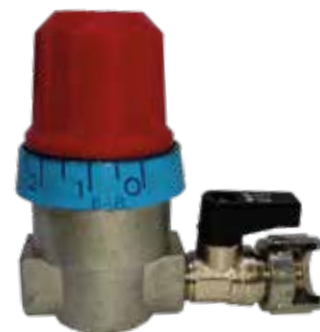
REGULADOR + TORNEIRA BAIONETA