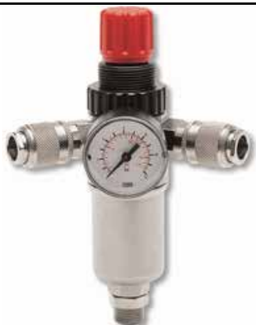
COM MANÓMETRO + 2 ENGATES RÁPIDOS