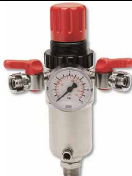
COM MANÓMETRO + 2 TORNEIRA E BAIONETA