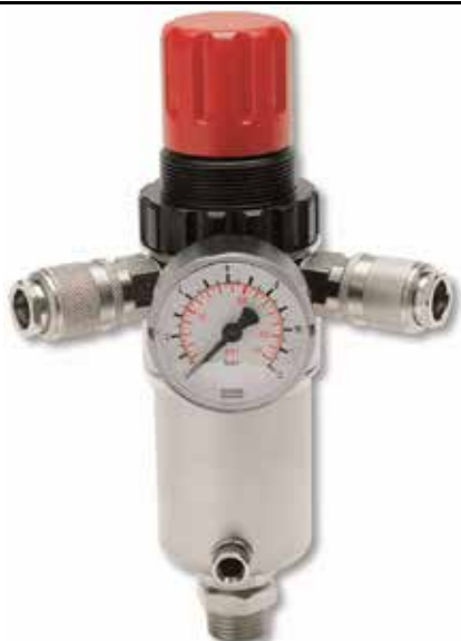
COM MANÓMETRO + 2 ENGATES RÁPIDOS