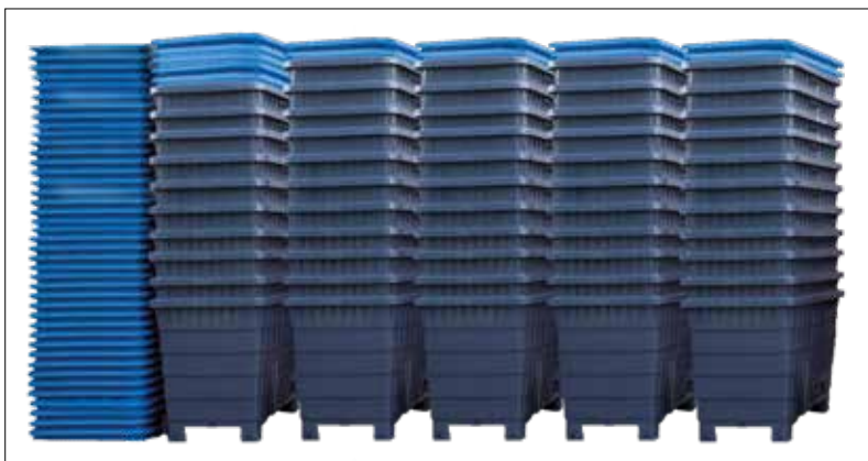
54 Multitanks encaixados ocupam 4,8m 2 .