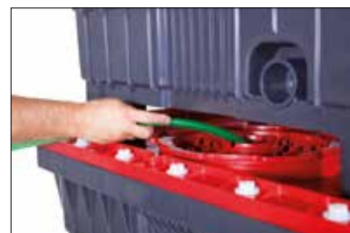
Mesmo quando empilhados, é possível aceder ao interior do contentor, e verificar a qualidade dos produtos de forma rápida e fácil.