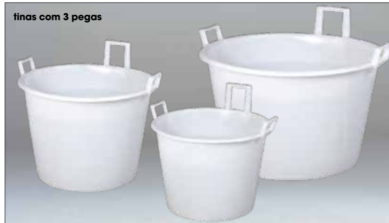
tinas com 3 pegas

As cubas brancas abaixo são fabricadas em HDPE resistente ao gelo e adequado para alimentos. São aplicáveis em inúmeras indústrias, tais como pesca e panificação.