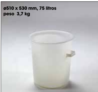
ø510 x 530 mm, 75 litros peso 3,7 kg