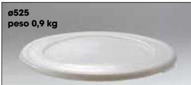
ø525 peso 0,9 kg