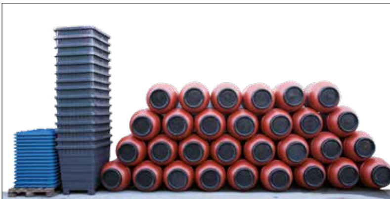
Armazenamento de tambores vazios. O Multitank ocupa menos 65% de espaço do que os tambores de plástico.

Para além de todas as vantagens técnicas o Multitank potencia a redução de custos em comparação com tambores, bidões ou contentores IBC. A utilização de paletes de madeira ou plástico é redundante dadas as características dos seus pés. Os sacos são desnecessários. Verifica-se uma redução de 65% na área utilizada para armazenamento porque os contentores encaixam quando vazios (em comparação com tambores e bidões).