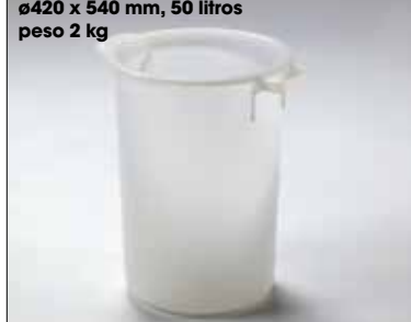
ø420 x 540 mm, 50 litros peso 2 kg