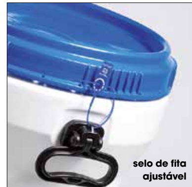
selo de fita ajustável