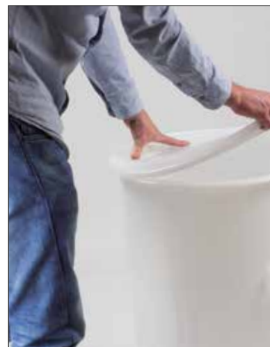
Tampa de encaixe para cilindros.