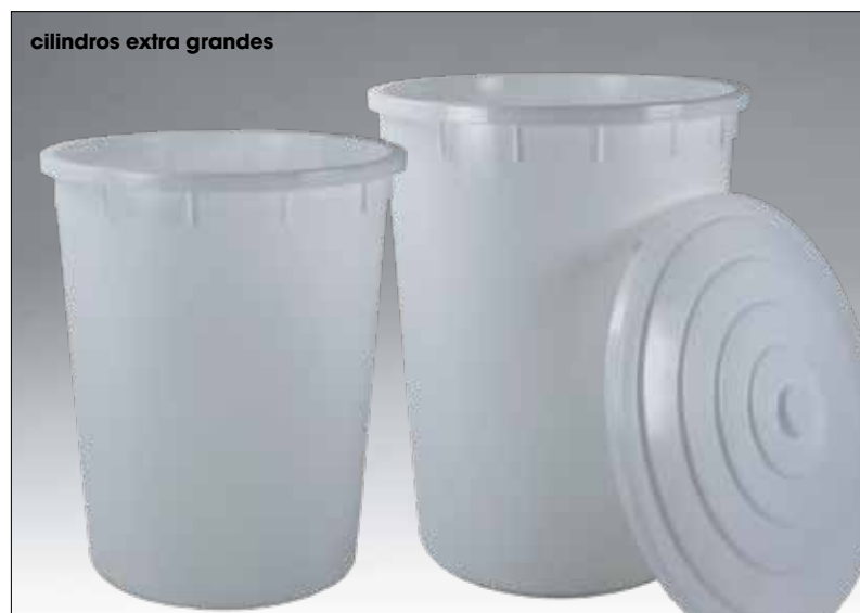
cilindros extra grandes