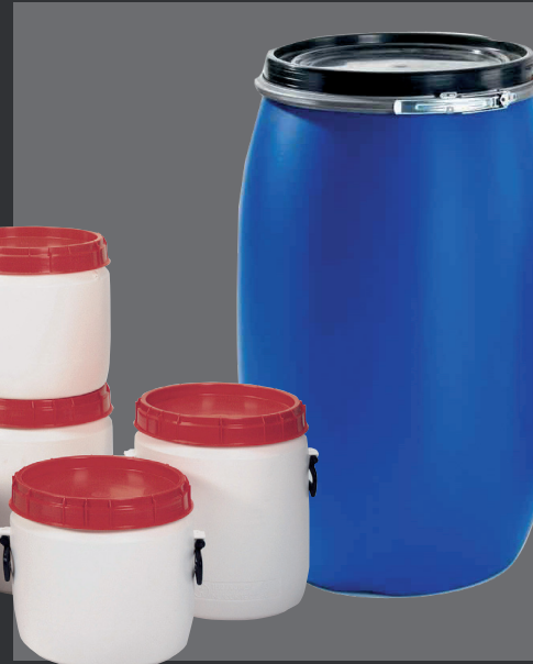
Bidões (de boca larga)