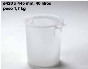
ø420 x 445 mm, 40 litros peso 1,7 kg

Os cilindros possuem um grande volume de até 200 litros e são encaixáveis até 2/3, para que possam ser igualmente fáceis de separar. Os cilindros têm pegas laterais, mas também podem ser movimentados através do rebordo superior. Se necessário, podem ser fornecidos com uma tampa de encosto ou uma tampa de encaixe. Adequado para o armazenamento e transporte na indústria alimentar.