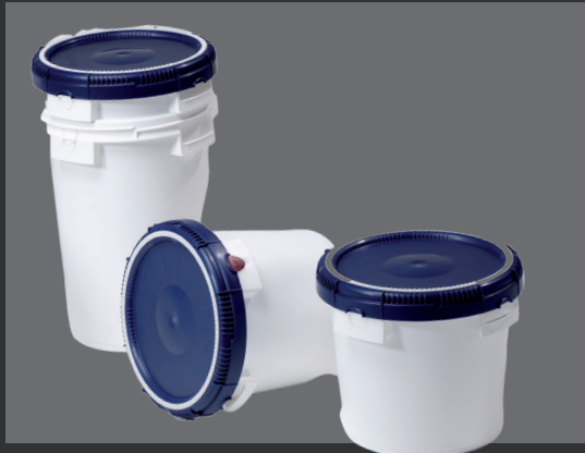
Recipientes e baldes com tampa