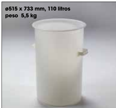
ø515 x 733 mm, 110 litros peso 5,5 kg