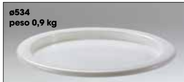
ø534 peso 0,9 kg