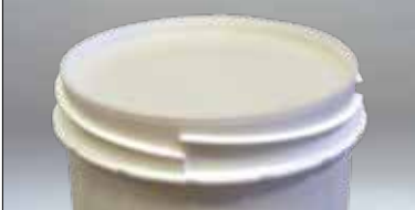
tampa interior transparente

Estes baldes com tampa são seláveis e cumprem todos os requisitos ADR para transporte de substâncias sólidas. A embalagem é composta por uma caixa de dez unidades.