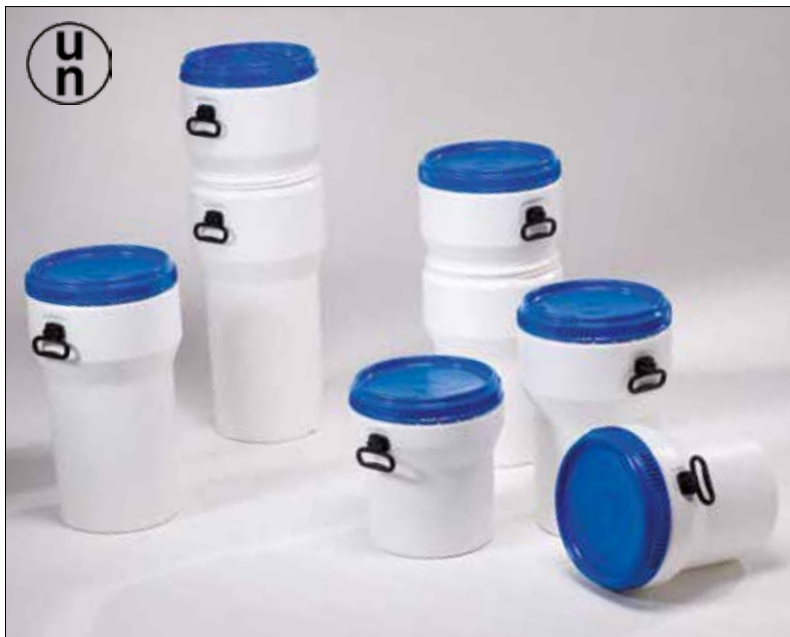
Bidões encaixáveis com pegas e capacidade de 30 a 60 litros. Poupança de espaço e utilização ergonómica:

Os bidões encaixáveis com tampa de enroscar possuem certificação da ONU (1H2), tal como os bidões de boca larga, para substâncias sólidas e são adequados à utilização com produtos alimentares. A vantagem adicional consiste no facto de ocuparem menos espaço quando estão vazios, visto que podem ser encaixados. Fáceis de remover devido às pegas.