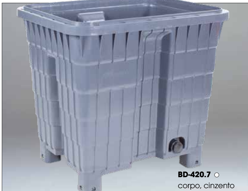
BD-420.7 ○ corpo, cinzento

Em baixo encontrará os componentes do Multitank. Também existe um saco assético disponível para o Multitank. Contacte o departamento comercial para obter mais informação. Consulte também o nosso programa de caixas-paleta (a partir da página 197).