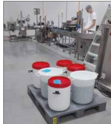
Bidões de boca larga e cilindros para ingredientes.