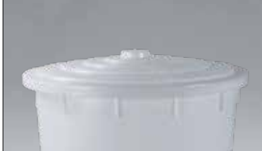
tampa para cilindro ajustável