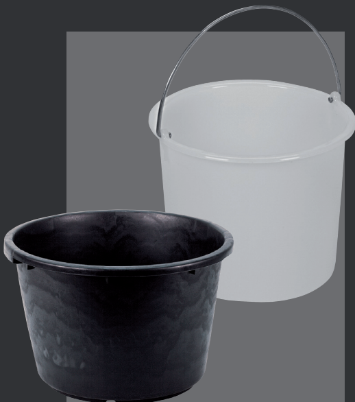
Baldes e tinhas